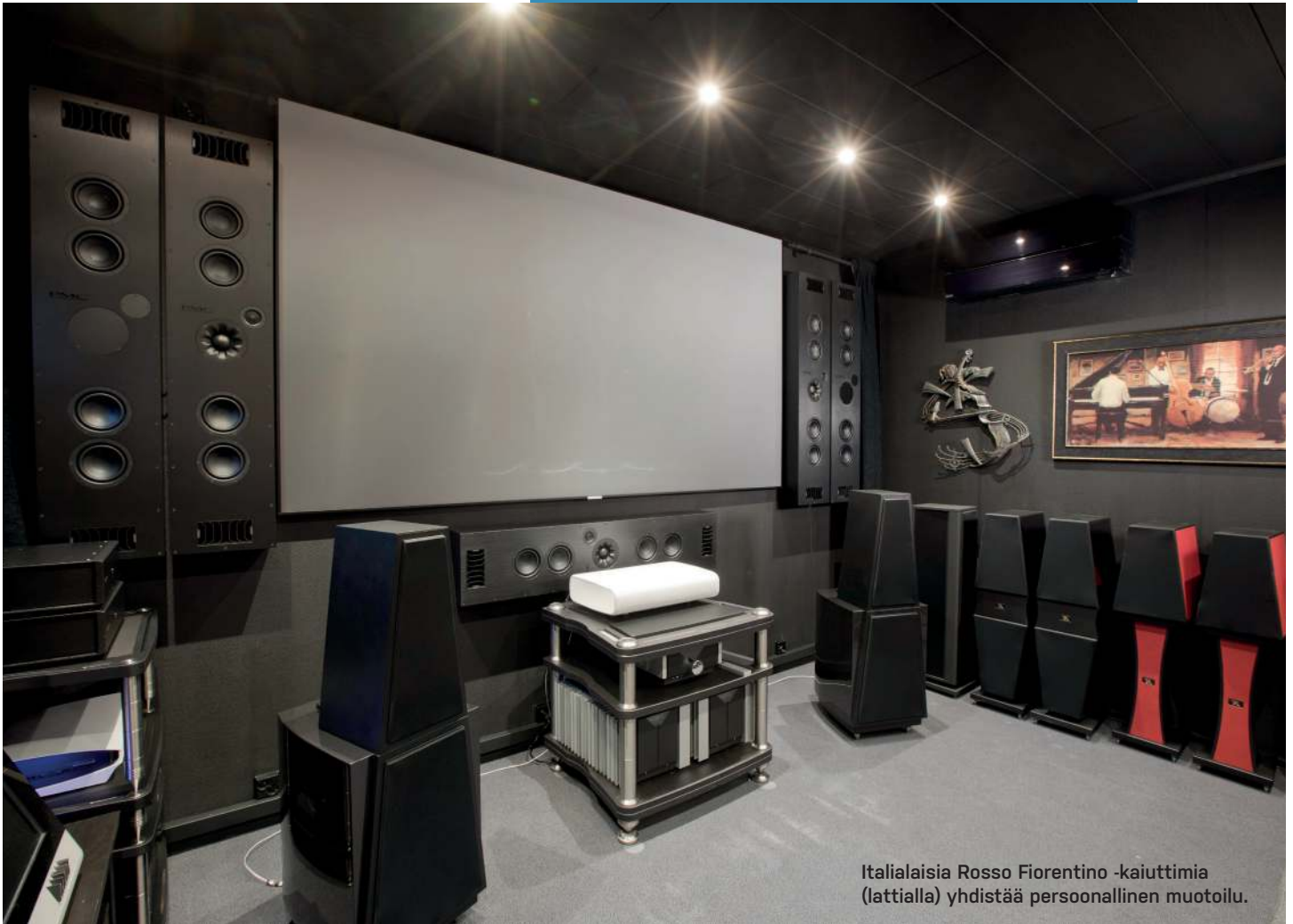
Italialaisia Rosso Fiorentino -kaiuttimia (lattialla) yhdistää persoonallinen muotoilu.

Etsin katseellani subwooferia lattialta. Isäntä aavistaa päylyyni tarkoituksen ja sanaakaan sanomatta astelee kankaan eteen. Pienen puuhailun jälkeen laitimaisen PMC:n suojaverkko irtoaa ja alta paljastuu seinäasennettava subwoofer mallia ci140 sub. Toinen samanlainen on kankaan toisella puolella. Kummassakin on neljä kappaletta 13,3 senttimetrin halkaisijalla varustettua elementtiä transmissiolinjakoiteloituna.