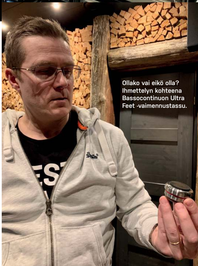
Ollako vai eikö olla? Ihmettelyn kohteena Bassocontinuum Ultra Feet -vaimennustassu.