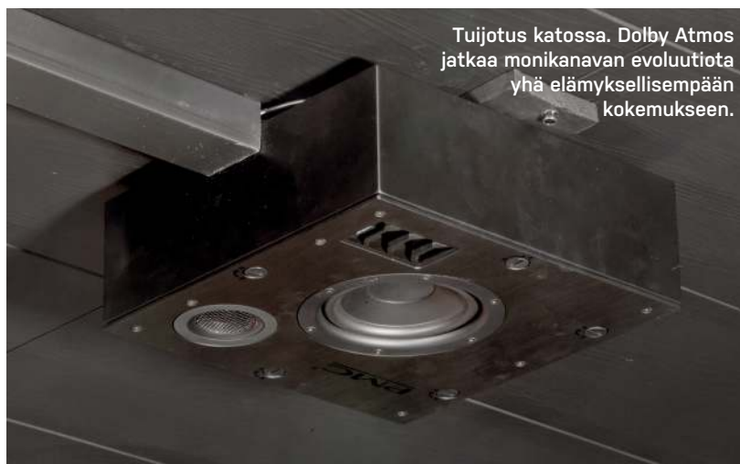
Tuijotus katossa. Dolby Atmos jatkaa monikanavan evoluutiota yhä elämyksellisempään kokemukseen.